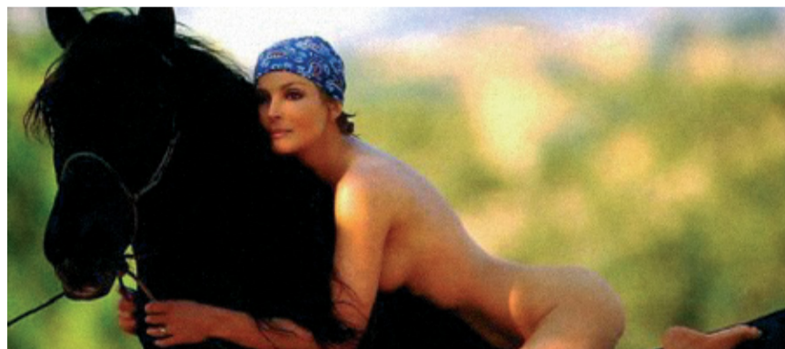
unsere erste Vorreiterin: In etwa so...

Zwischen 20-30 J., Blond und moralisch locker